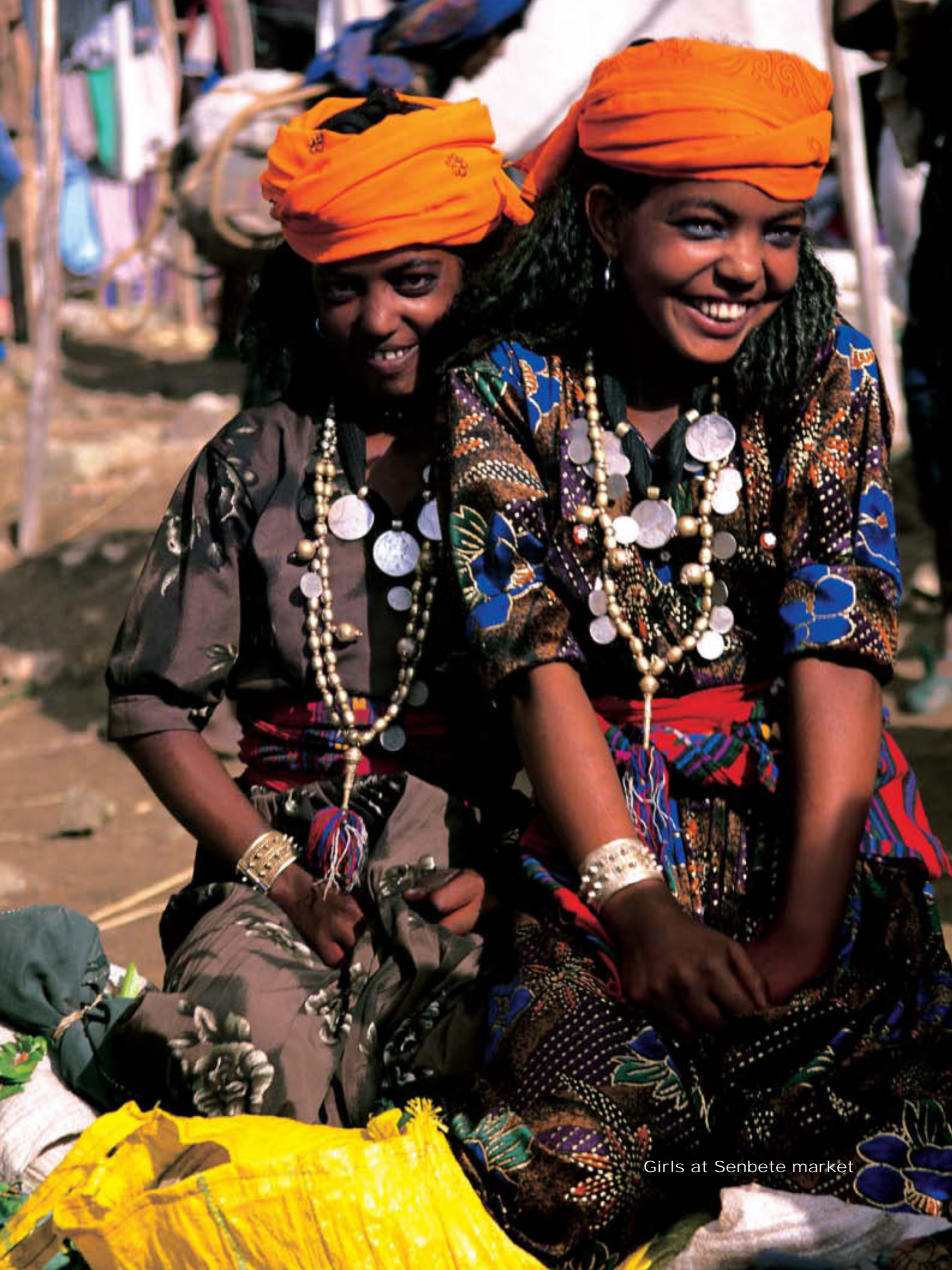
Girls at Senbete market