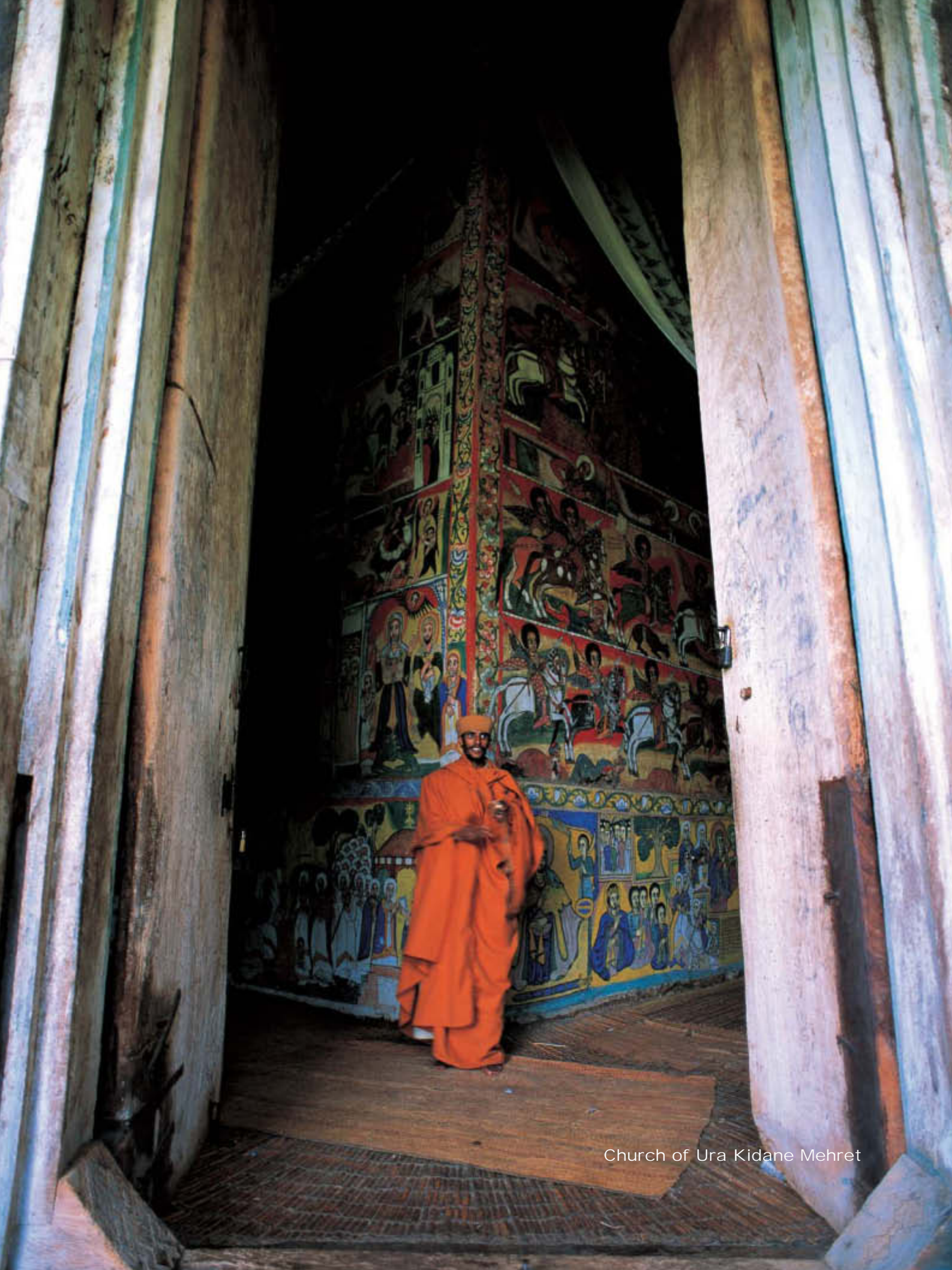
Church of Ura Kidane Mehret