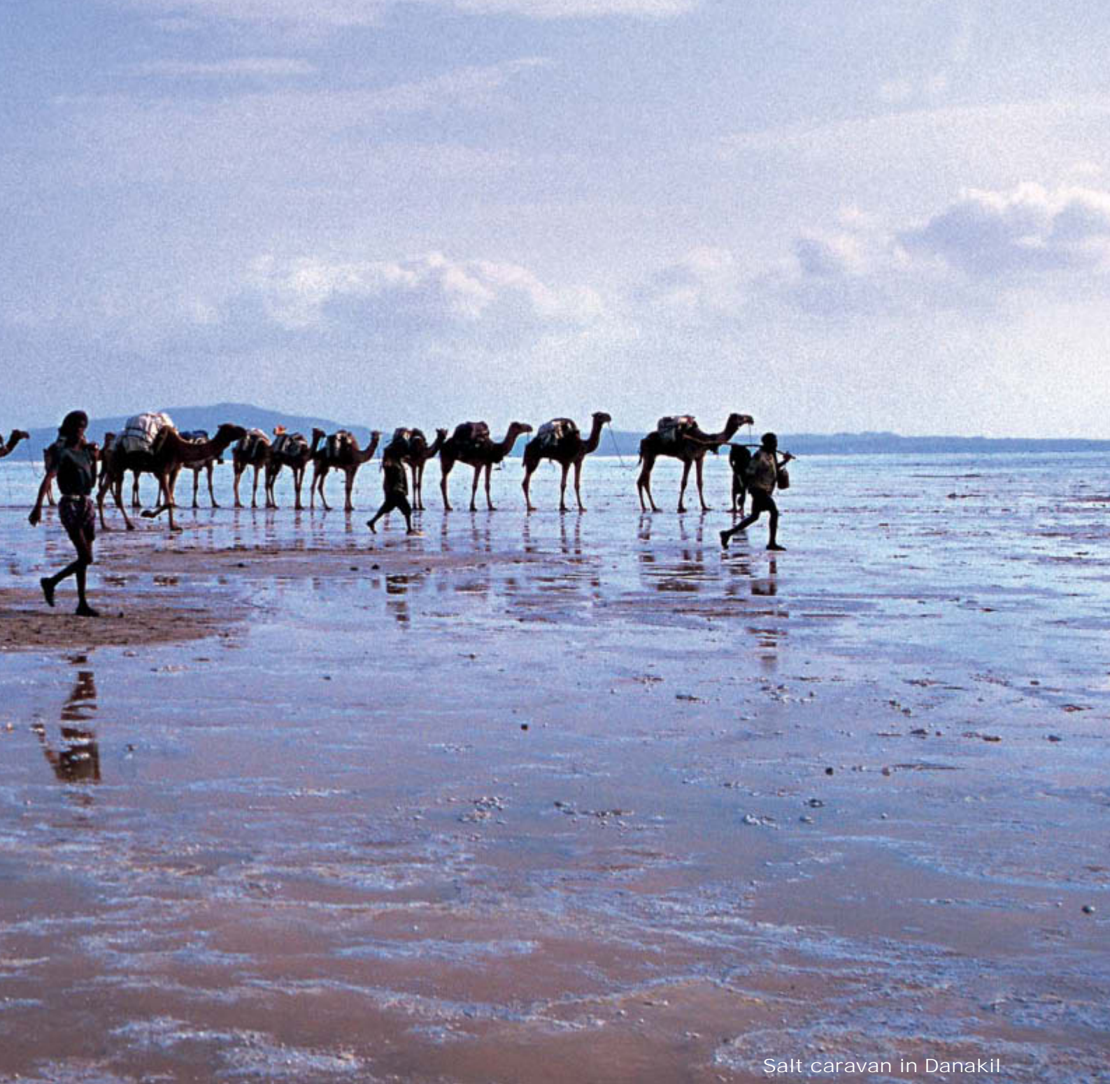
Salt caravan in Danakil