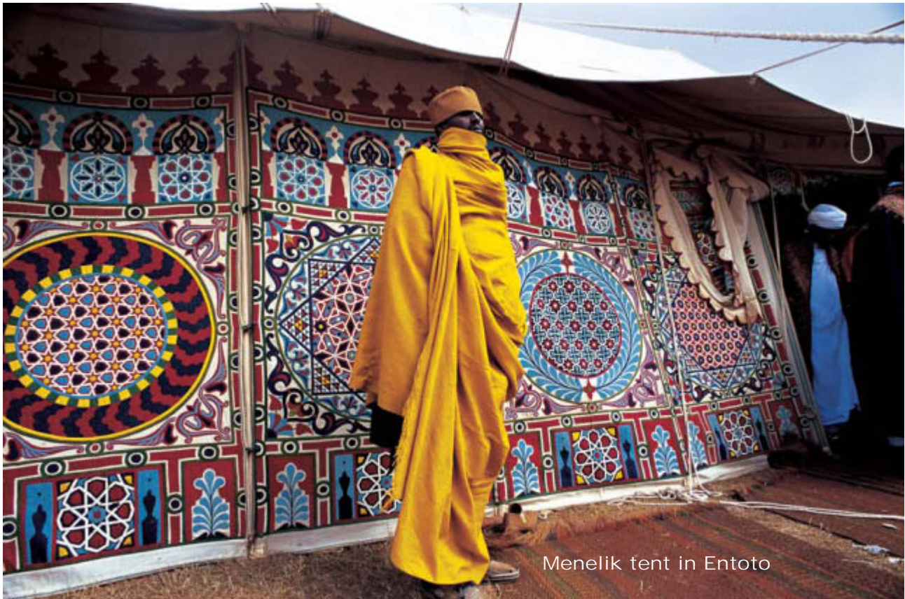
Menelik tent in Entoto

nial past as well. Moving towards west, one of the mandatory stops is the National Park of Gambella, a paradise for birds immersed in a lush green valley with rivers, villages and vast coffee plantations. Another must-see place is Simien Mountains National Park, a homeland for a vast number of species such as baboons, deer, Simien fox and Gypaetus Barbatus, a huge vulture. One can climb high to the top of Simyen Mountains, over 4 600 meters of altitude, or meet the Islamic Africa in Harar, a city of incredible beauty and declared a World Heritage site by UNESCO. One may also head for Jijiga, the final frontier before Somalia, where one can see the miraculous Dakhata Valley of volcanic rocks and wild, uncontaminated nature. Then there is the possibility of being encompassed by a certainly difficult but fascinating metropolis